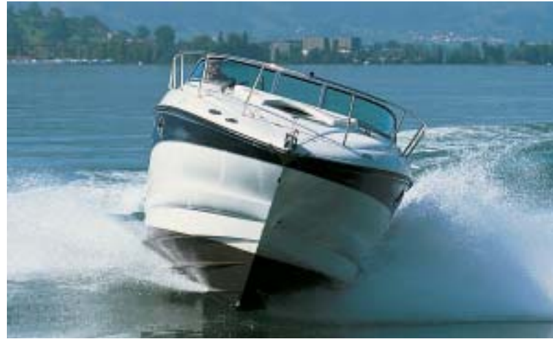
Schlanke Linien und ausgezeichnete Fahreigenschaften zeichnen die Crownline 250 CR ebenso aus wie ihre funktionelle Cockpit-Einrichtung.