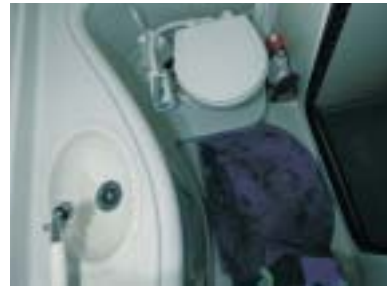
Die 250 CR bietet in ihrem Inneren alle Einrichtungs-elemente, die man für einen erholsamen Urlaubstörn benötigt: V-Sitzgruppe mit Tisch, Pantry, Nasszelle und gesamt drei Schlafplätzen.