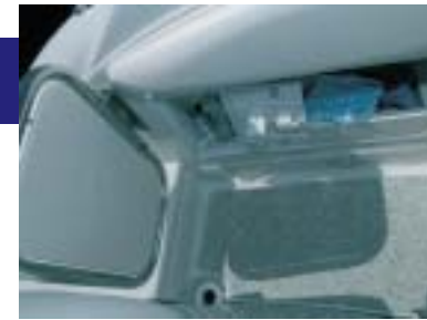
Heckdusche und Unterflur-Beleuchtung zählen zum Standard.

Stoffen in der Kabine bis hin zu den Installationen von Elektrik, Motor und Peripherie. Alles hat seinen Platz, nichts wurde dem Zufall überlassen und die Verarbeitungsgüte stimmt auch dort, wo man normalerweise keinen Einblick hat, nämlich hinter den Kulissen. Das Qualitätsbewusstsein und -bestreben der jungen Werft ist beeindruckend. Sie hat wirklich einen Cruiser geschaffen, bei dem Design, Funktionalität und Qualität ein harmonisches Gesamtes abgeben.