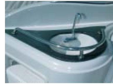
Die Wetbar ist mit einem kleinen Spülbecken und einer Kühlbox ausgestattet.