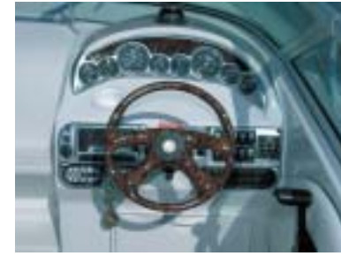
Hier lässt es sich gut arbeiten: Der Steuerstand bietet alle Vorzüge einer modernen Kommando-Zentrale.

Bei der 250 CR stimmt einfach alles. Angefangen bei den Designer-